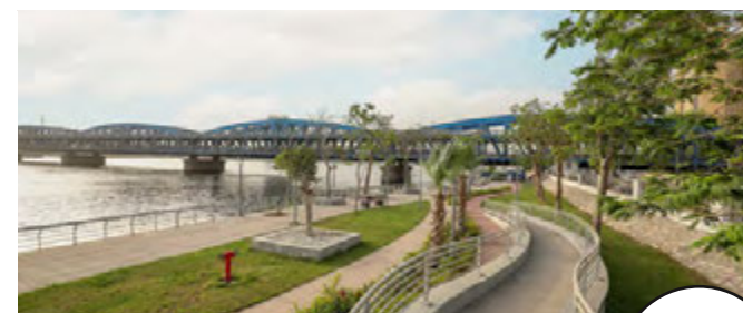
ممشي اهل مصر حسن علام للطرق والكبارى