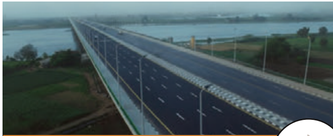
مشروع الوراق حسن علام للطرق والكبارى