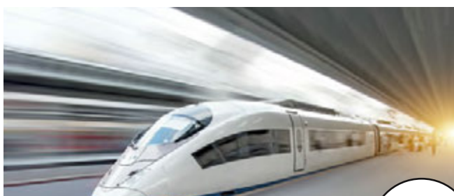
القطار الكهربائى حسن علام للطرق والكبارى