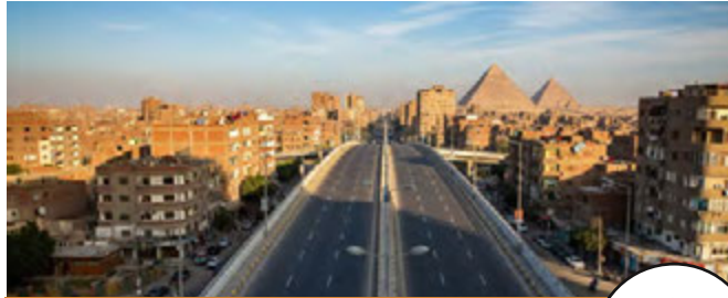
كوبرى المريوطيه حسن علام للطرق والكبارى