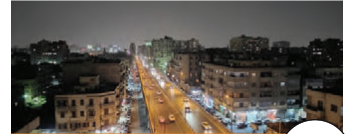
كوبرى احمد سعيد حسن علام للطرق والكبارى