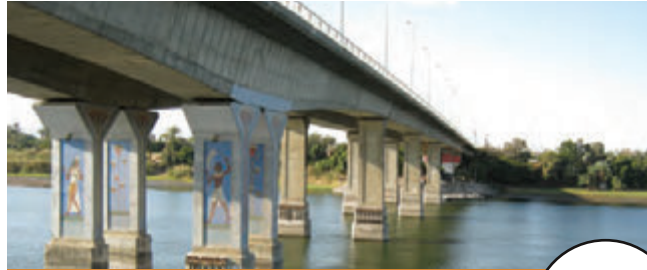
كوبرى الأقصر حسن علام للطرق والكبارى