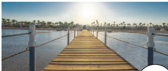
كوبرى شرم الشيخ حسن علام للطرق والكبارى