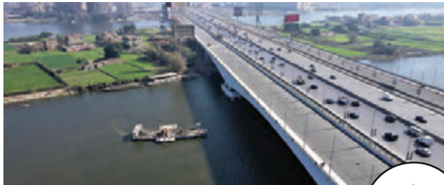
كوبرى المنيب حسن علام للطرق والكبارى