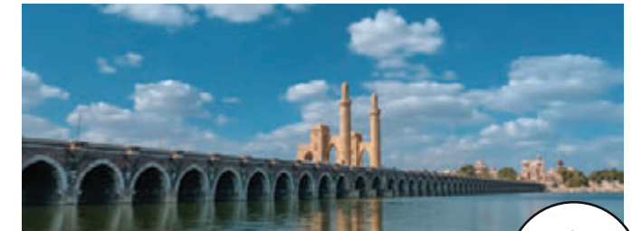
دمسه كوبرى القناطر حسن علام للطرق والكبارى