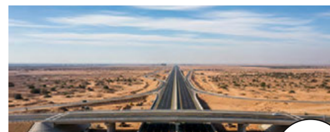
محور الضبعه الجديد حسن علام للطرق والكبارى